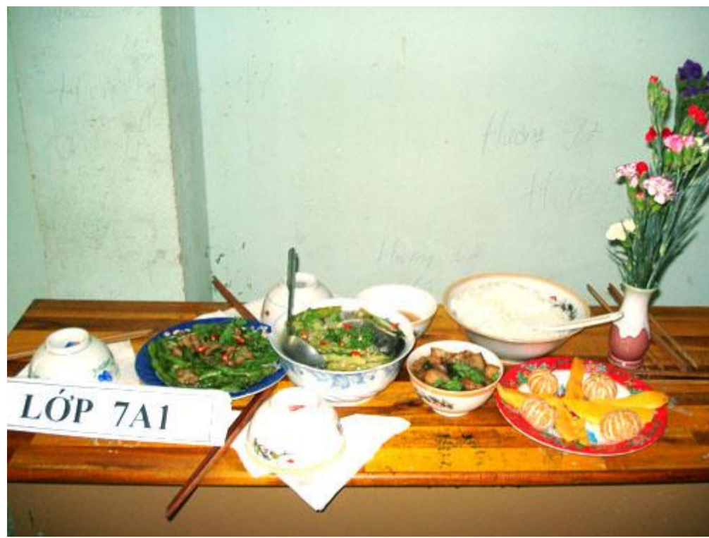
Còn đây là sản phẩm của các đầu bếp nhí lớp 7A1.