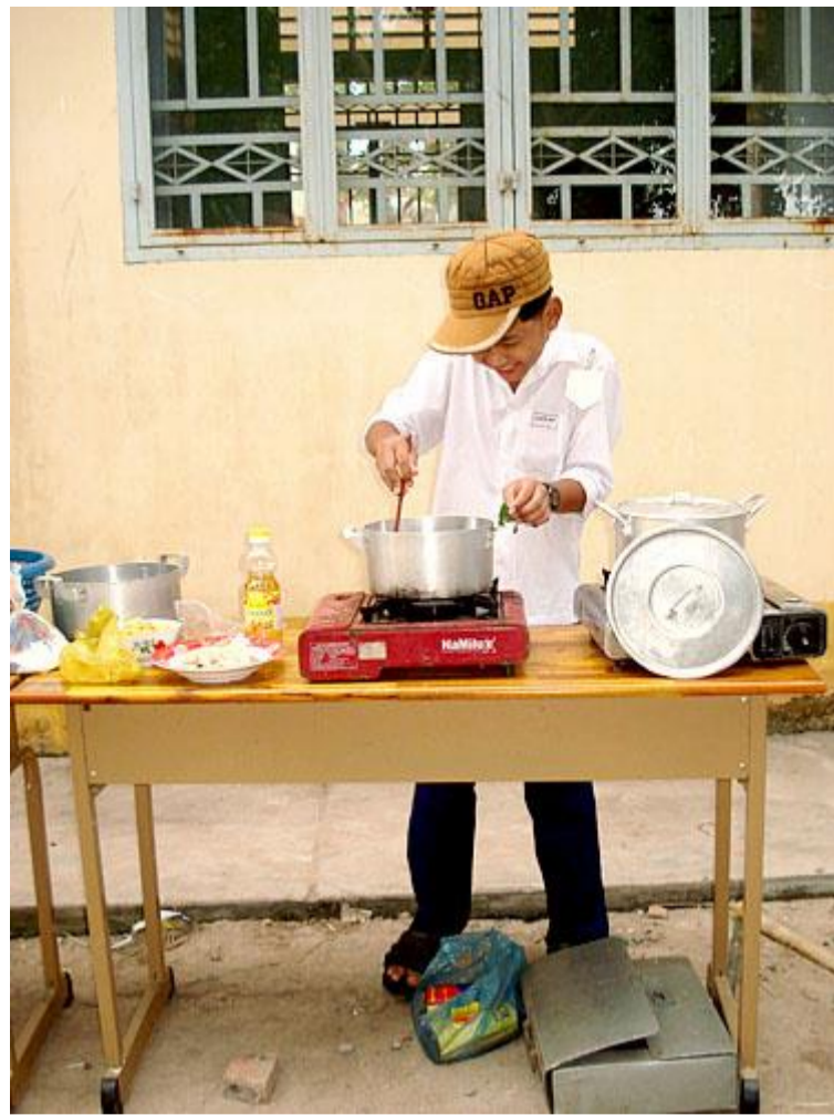
Ý! ... Khét rồi kia!