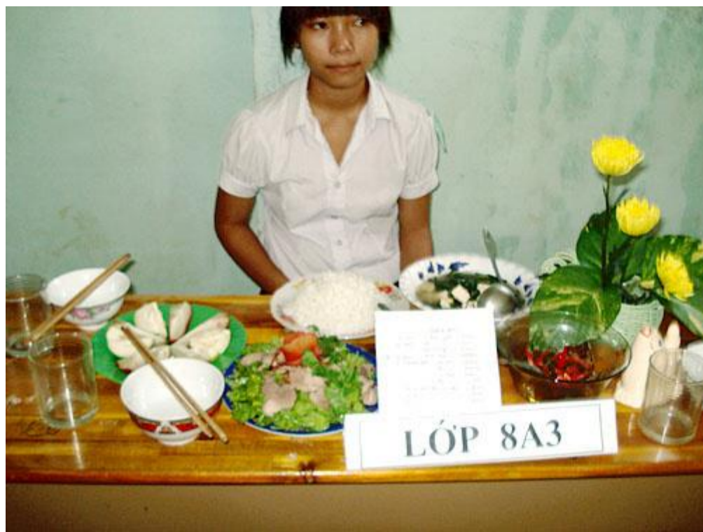
Hình sự quá!