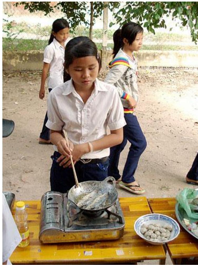
Học sinh lớp 6A đang thực hiện món cá rán.