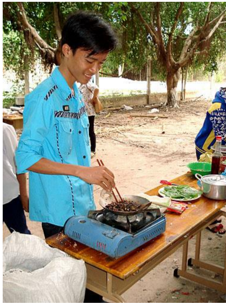
Món đặc sản "Đế rôti".