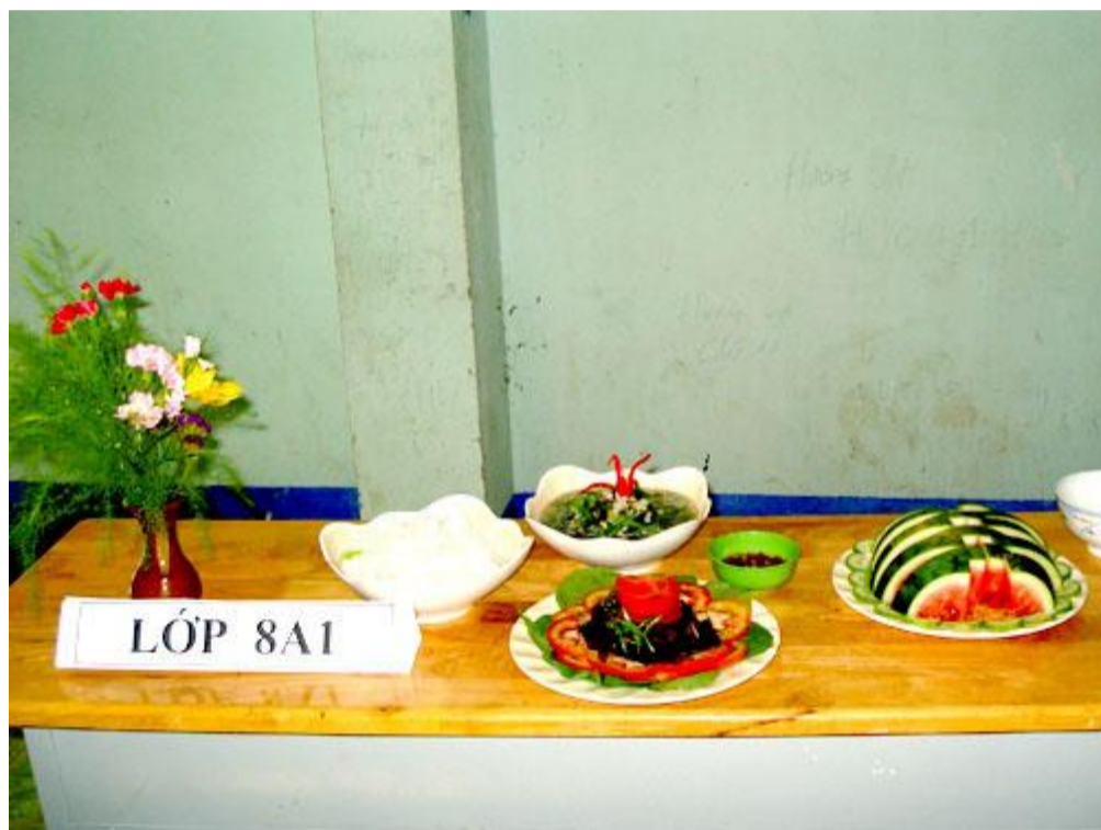
Còn đây là thành quả của lớp 8A1 với cơm, canh và dế rôti.