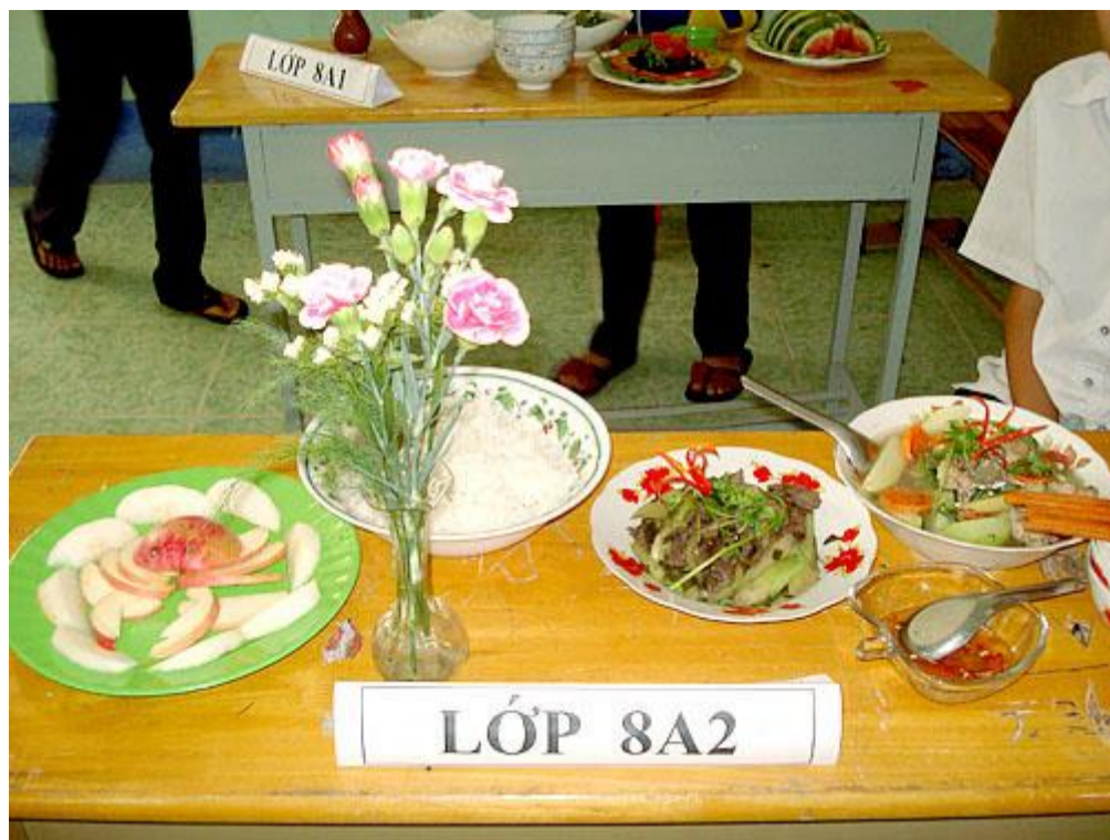
Sản phẩm của lớp 8A2 kèm với món tráng miệng: dưa ướp lạnh!