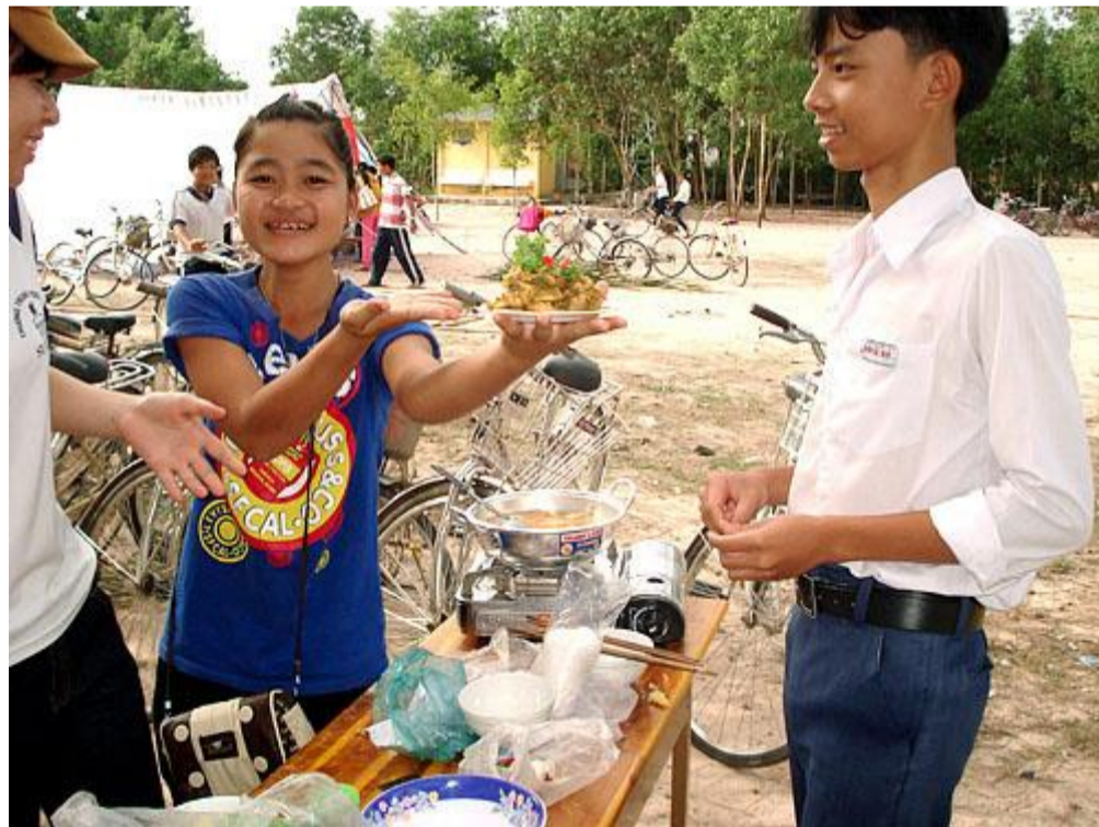
Tác phẩm :thịt gà kho xả ớt" của lớp 9A3