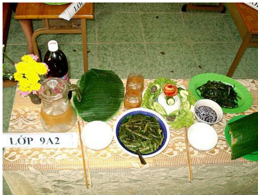
Sản phẩm "món ăn dân dã" của lớp 9A2