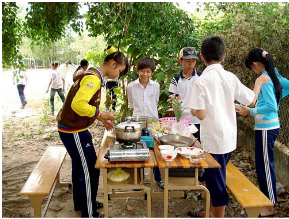
Làm gì vui thế?! (Lớp 8A2)