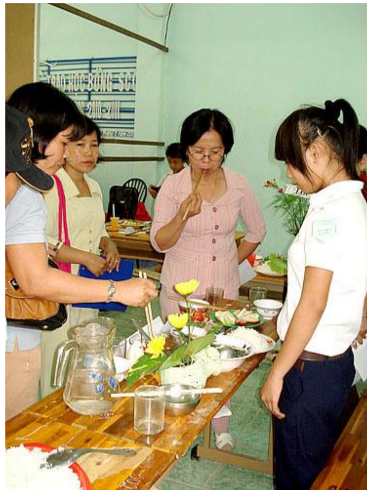
Món này được đấy!