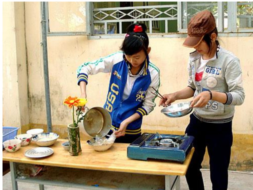
Cẩn thận! Coi chừng đổ!