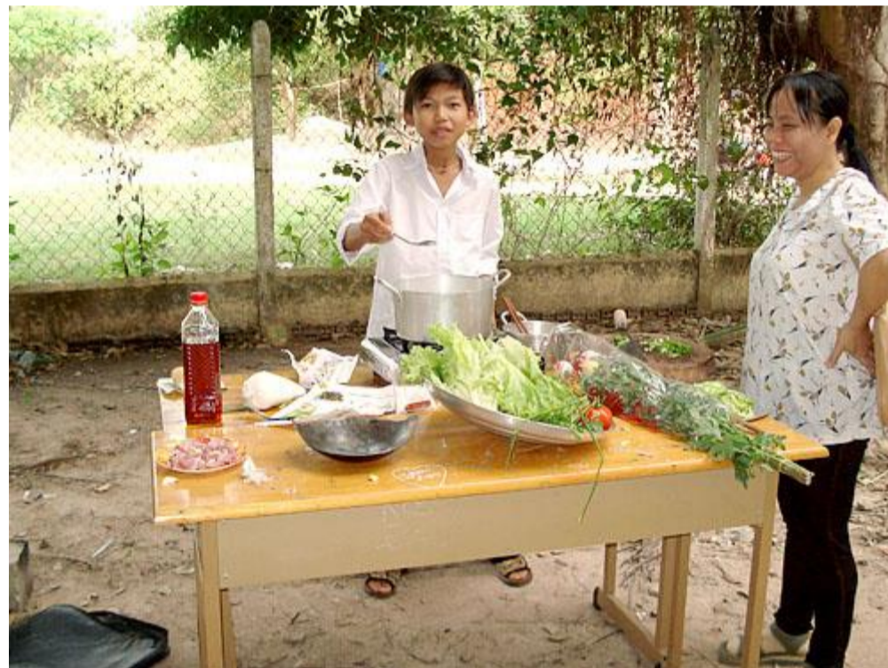
Ném thử đi rồi biết!