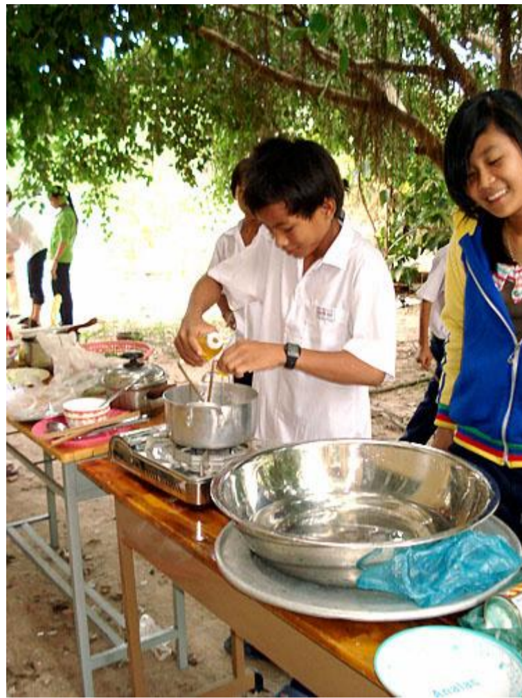
Hai đầu bếp của lớp 8A4 đang thực hiện món ... gì chưa biết!