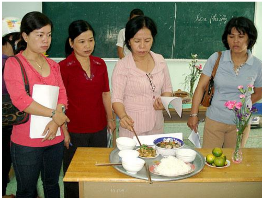
Ban giám khảo đang kiểm tra chất lượng các món ăn.