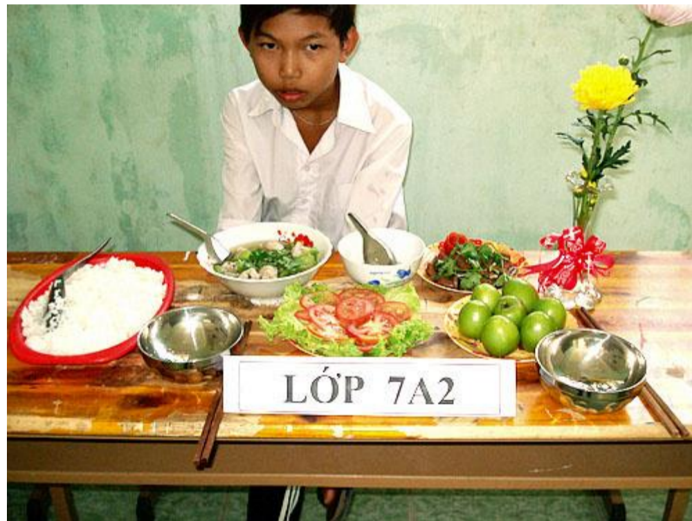
Hông được ăn! Buồn quá!.....